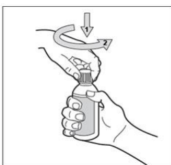
Εικόνα 2: Καπάκι παιδικής ασφάλειας

Προκειμένου να ανοιχθεί ο περιέκτης επαναπλήρωσης, αρχικά πιέστε το καπάκι και έπειτα ξεβιδώστε (εικόνα 2). Έπειτα τοποθετήστε το προσαρμοσμένο ακροφύσιο στο στόμιο της δεξαμενής του ηλεκτρονικού τσιγάρου μεταξύ της αντίστασης και των τοιχωμάτων της δεξαμενής και εγχύστε το υγρό στη δεξαμενή (εικόνα 3). Μην γεμίσετε τη δεξαμενή πάνω από την ένδειξη Μέγιστης χωρητικότητας (Max) της συσκευής, προκειμένου να αποφευχθεί υπερχειλίση του υγρού (εικόνα 4).